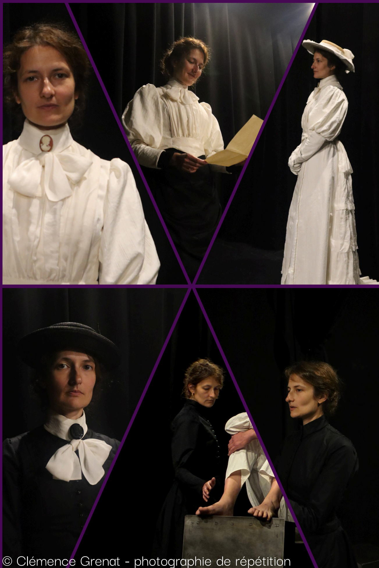
photographie de répétition

Lucie Dreyfus-Hadamard, fille d'un négociant en diamant, s'est mariée avec Alfred en 1890.