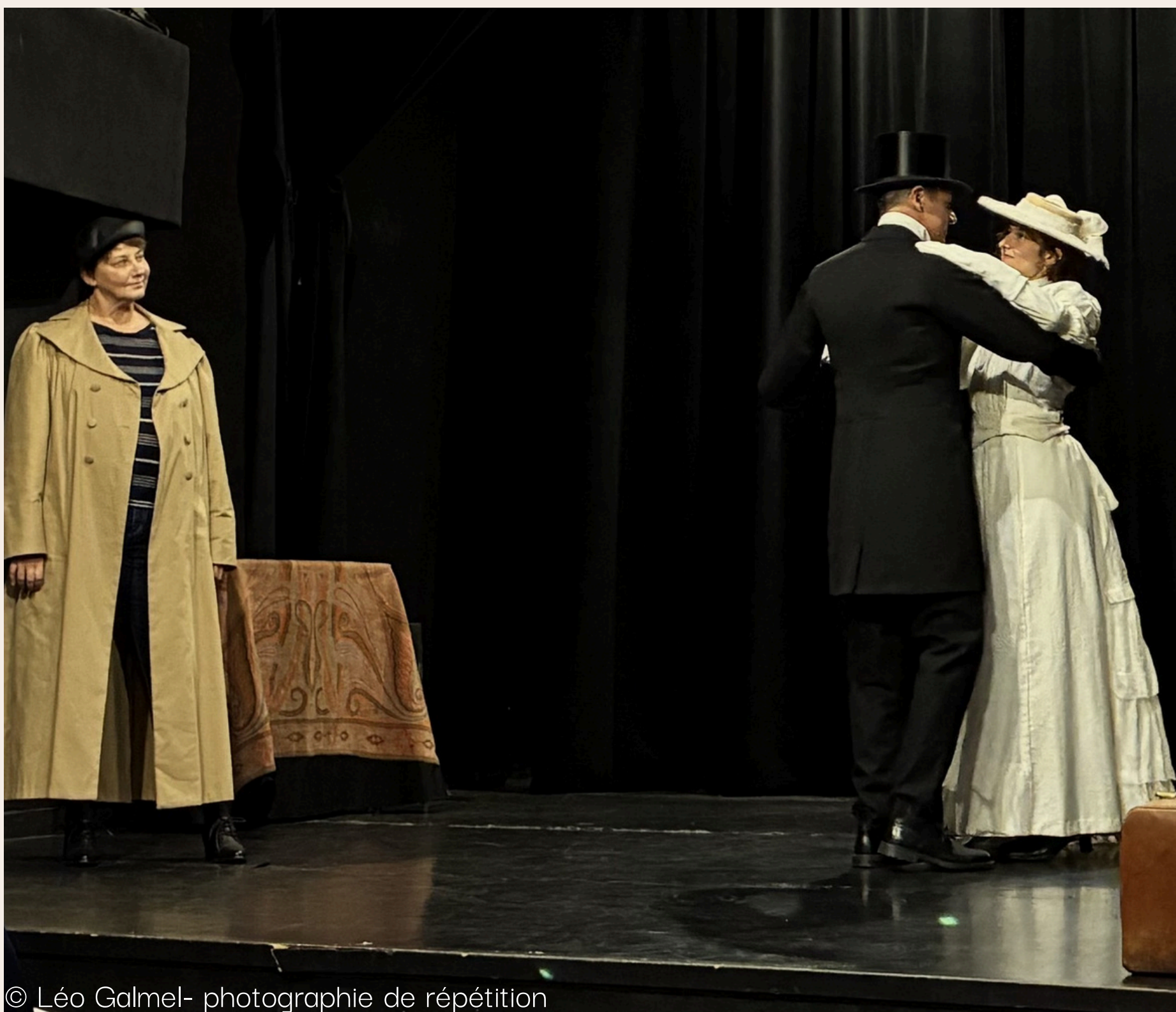
© Léo Galmel- photographie de répétition