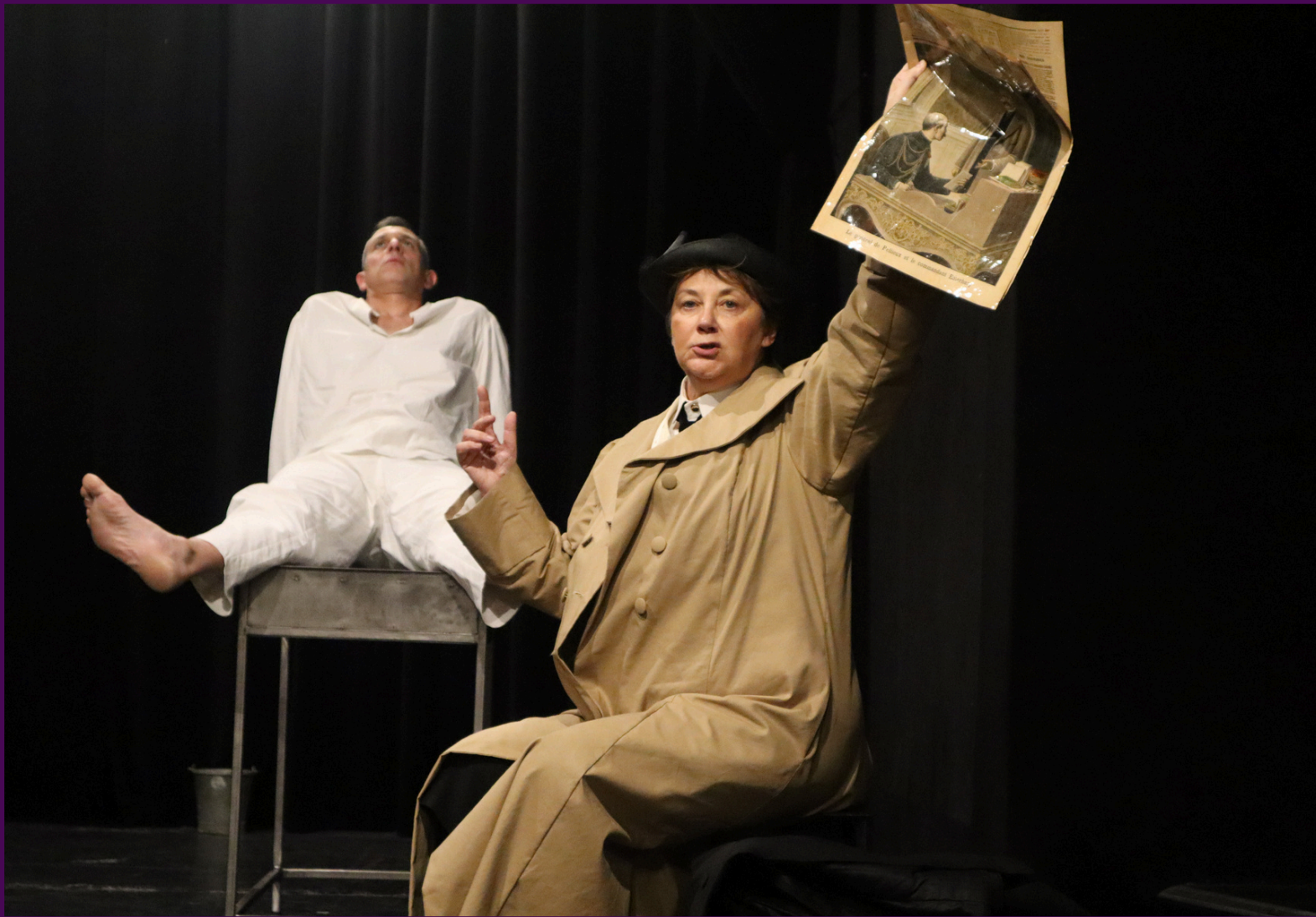
photographie de répétition