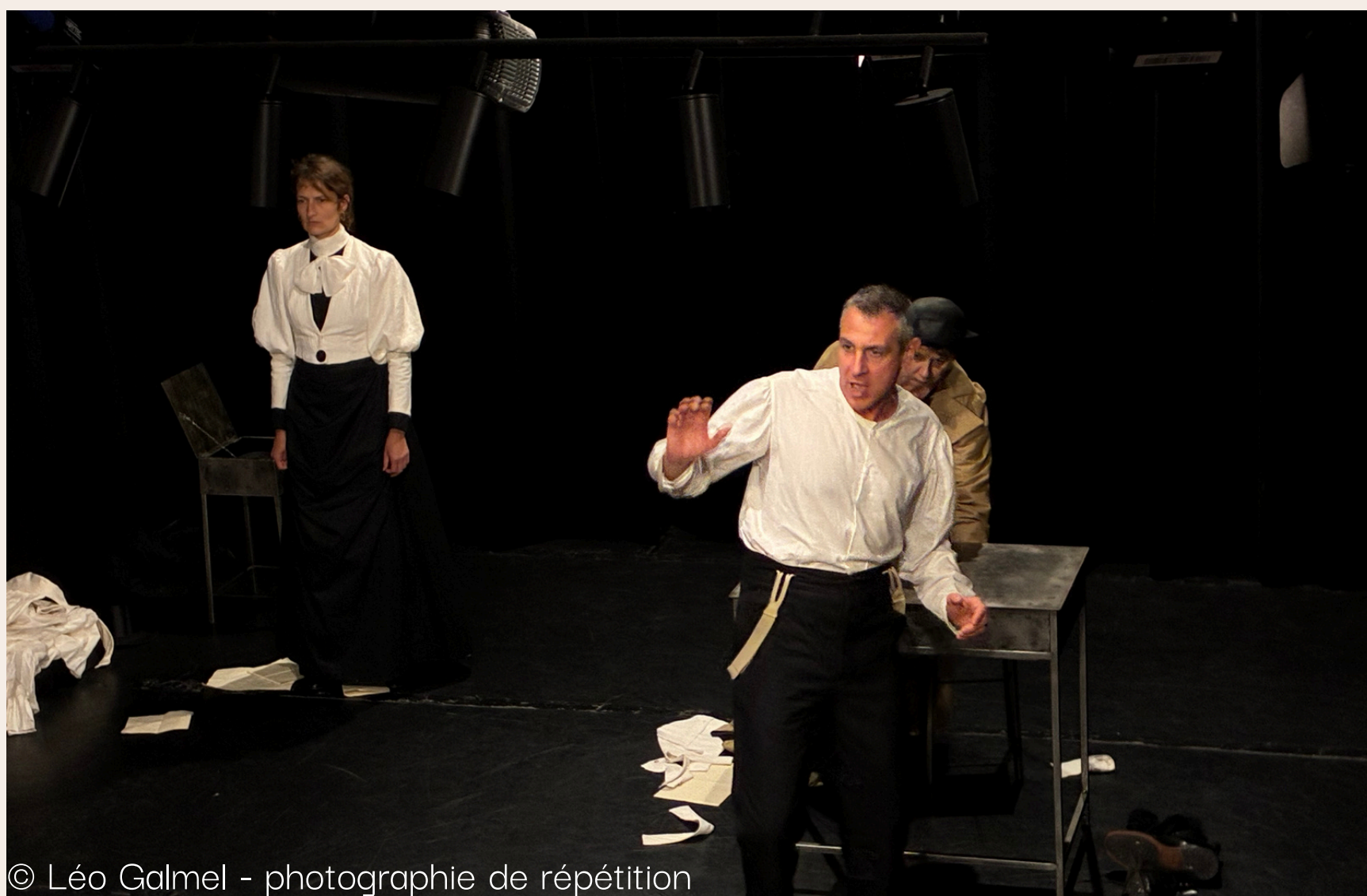
photographie de répétition

« Si tu veux que je vive... est une injonction d'Alfred Dreyfus à Lucie, sa jeune épouse, au moment où en détention, il perd pied. A travers ce pacte passé entre ces deux êtres, notre création relate une histoire d'amour hors norme. Contrairement aux mœurs bourgeoises où les mariages sont souvent de raison, Alfred et Lucie se sont unis au nom de sentiments partagés et sincères. Il faut mettre aujourd'hui à l'honneur Lucie, grande oubliée de l'Affaire. Sa force, sa capacité à maintenir le cap, son soutien sans faille sont une évidence. Sans Lucie, Alfred aurait sombré, n'aurait jamais connu sa réhabilitation et ne se serait pas devenue cette figure du courage porteuse des valeurs de la République et de l'universalisme. Autour du couple Dreyfus, se dessine une autre figure féminine en la personne de Caroline Rémy, dite Séverine. Personnalité incontournable de son temps, Séverine est écrivaine, journaliste, féministe... elle est de tous les grands combats sociétaux. Née en 1855, elle est pourtant déjà tournée vers les enjeux majeurs du XXème siècle. Révoltée par la machination ourdie contre le capitaine Dreyfus, par le climat délétère ambiant, par l'antisémitisme affiché au grand jour, Séverine est présente aux côtés de Zola, Péguy, Lazare, Jaurès... pour que vérité soit faite. Sur scène, par les artifices propres au théâtre, Séverine fait le lien avec le public, l'interroge, l'informe... pour nous conter "l'histoire invraisemblable" d'Alfred et Lucie Dreyfus. »